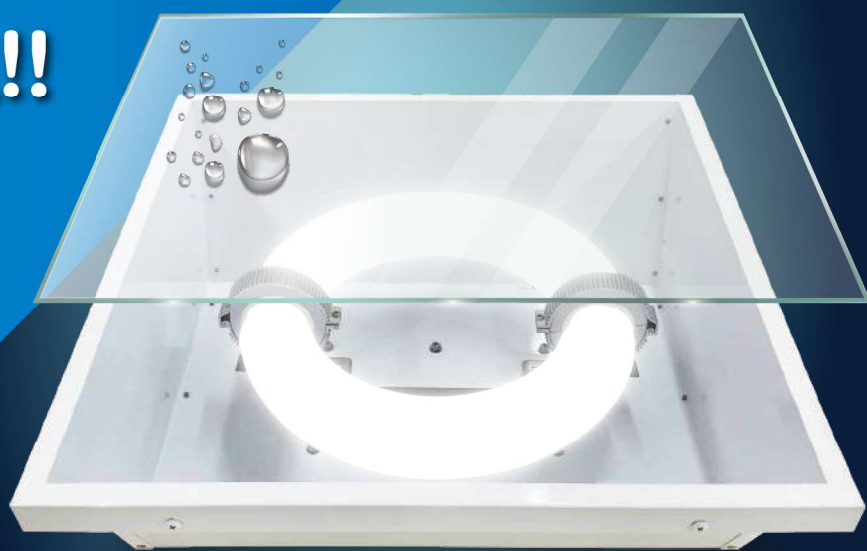
※イメージ図 実際の製品は本体とカバーは一体型です