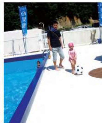
駒立町子供プールエントランス