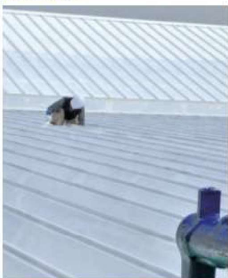
トヨタ部品愛知共販(株) 豊川営業所