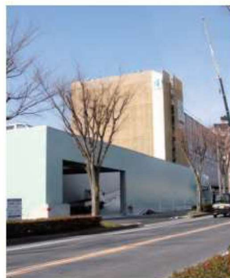
介護施設みなみの風